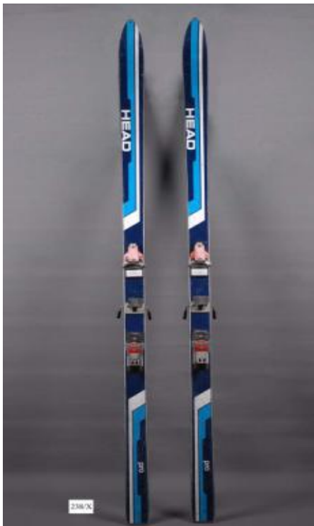
Narty ks. Kardynała Karola Wojtyły- używane do zimy 1978 r. Muzeum Archidiecezjalne Kardynała Karola Wojtyły w Krakowie