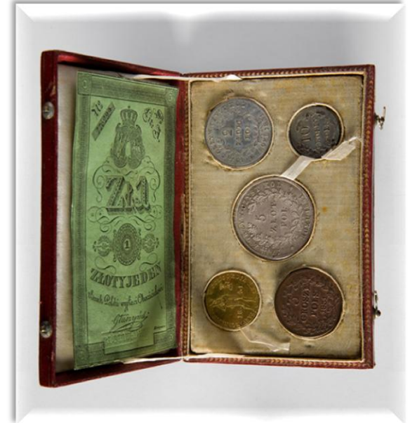
1 polski złoty - 1831 r. Muzeum Narodowe w Krakowie