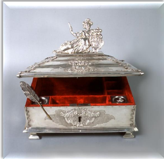
Lada na przybory pisarza Rady Miejskiej - 1751 r. Muzeum Historyczne Miasta Krakowa