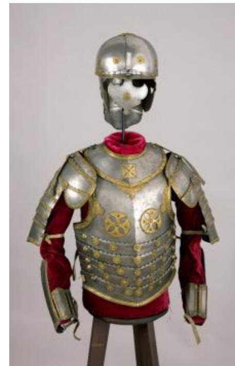
Półbroja husarska- Polska, 2. połowa XVII w.