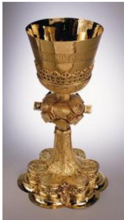
Kielich mszalny gotycki- Polska 1500 r.