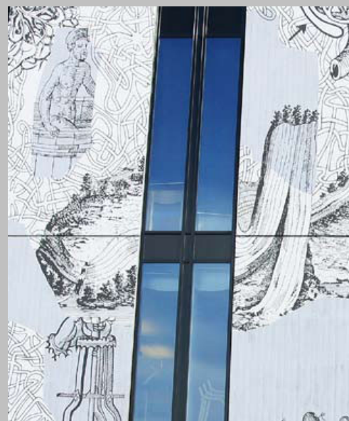
Szkoła wyższa w Akershus.

Reforma strukturalna powinna być kontynuowana w formie programu podniesienia standardu fizycznego środowiska bibliotecznego, którego celem jest tu uczynienie z bibliotek atrakcyjnego miejsca spotkań dla społeczności lokalnej i instytucji edukacyjnych.