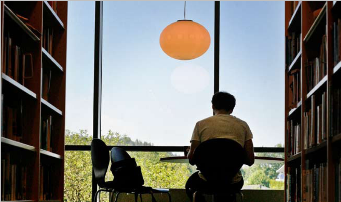
Biblioteka w Kolbotn.

oraz najważniejsze inicjatywy, jakie należy podjąć. Założeniem niniejszego raportu jest położenie podwalin pod reformę bibliotek, która zapewni ich trwałą modernizację i wyposażenie pozwalające sprostać przyszłym wyzwaniom.