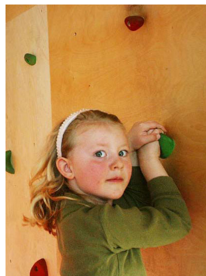
Biblioteka Wydz. Nauk Humanistycznych, Uniwersytet w Oslo.

W ramach proponowanych strategii przewiduje się przeprowadzenie do 2014 roku reformy bibliotek. Reforma ta uzależniona jest od funkcjonowania ogólnokrajowej sieci bibliotek – koncepcji o nazwie Norweska Biblioteka Ogólnokrajowa .