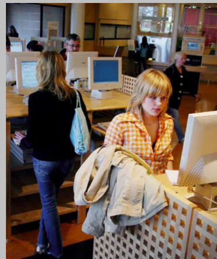
Biblioteka Wydziału Nauk Humanistycznych, Uniwersytet w Oslo.

Drugą główną inicjatywą jest promowanie bibliotek jako ośrodków gromadzących zasoby wiedzy oraz jako areny literatury i kultury. Biblioteki będą również wspierane w zwiększaniu swojego wkładu w integrację i różnorodność kulturową.