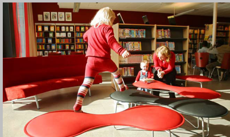
Biblioteka w Asker.

cyfrowej oferującej każdemu łatwy dostęp do wiedzy i kultury.